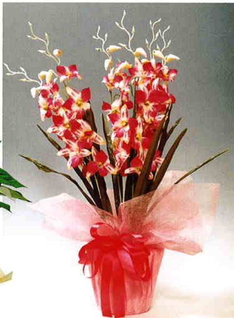
販売中止 品番/PF17 品名/デンドロビウム(赤/白) サイズ(約)/高さ65×幅40cm