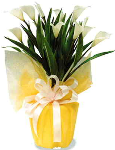
品番/PF19 品名/カラーリリー(白) サイズ(約)/高さ65×幅40cm