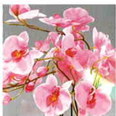
品番/PF8 品名/胡蝶欄(ラベンダー) 6本立 サイズ(約)/高さ65×幅40cm