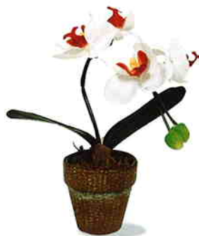
品番/PF14 品名/ミニ胡蝶蘭(白/赤) サイズ(約)/高さ22×幅10cm