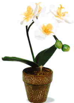
品番/PF12 品名/ミニ胡蝶蘭(白/黄) サイズ(約)/高さ22×幅10cm