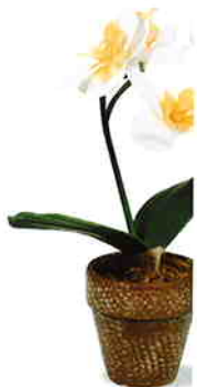
品番/PF12 品名/ミニ胡蝶蘭(白) サイズ(約)/高さ22