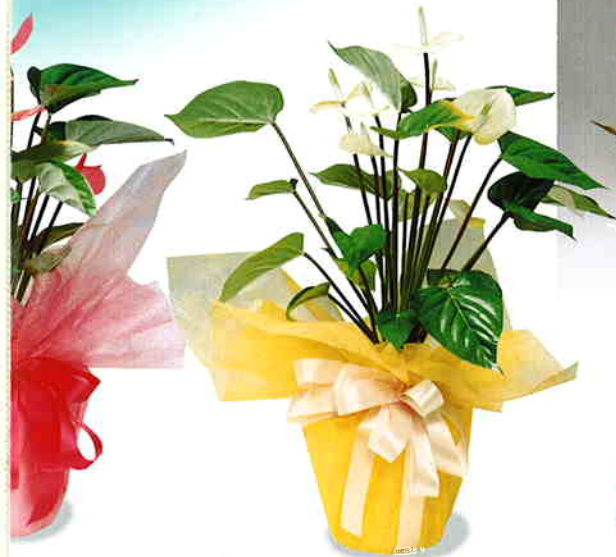
リュウム(ピンク) 高さ65×幅40cm