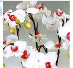
品番/PF6 品名/胡蝶欄(白/赤) 5本立 サイズ(約)/高さ65×幅40cm