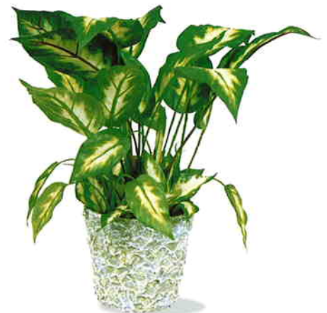
品番/PF38 品名/ディフェンポット サイズ(約)/高さ30cm×幅15cm