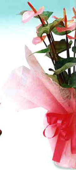
品番/PF15 品名/アンス サイズ(約)/