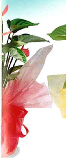
リューム(ピンク) 高さ65×幅40cm

ご家庭では、鮮やかなグリーンがなごやかな気分を作り出し、人の出入りが多いオフィスでは、緑のメッセージを伝える観葉植物。大型ですので、消臭・抗菌・空気清浄の効用も目に見えて得られます。