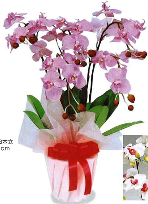
品番/PF5 品名/胡蝶欄(ラベンダー) 5本立 サイズ(約)/高さ65×幅40cm