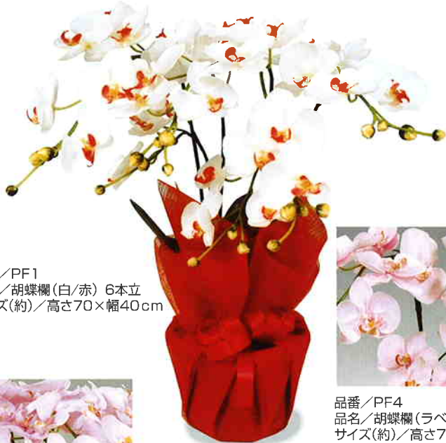
品番/PF1 品名/胡蝶欄(白/赤) 6本立 サイズ(約)/高さ70×幅40cm

高貴な花として、いつも人気の胡蝶欄。 美しくラッピングされていますので、記念日やお祝いなどの 贈り物として喜ばれる鉢物です。