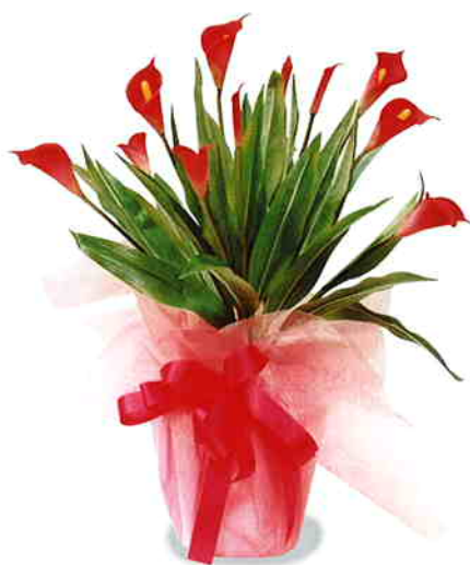
品番/PF18 品名/カラーリリー(赤) サイズ(約)/高さ65×幅40cm