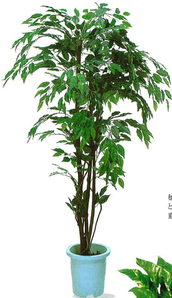
品番/PF34 品名/フィカスツリー サイズ(約)/高さ170cm