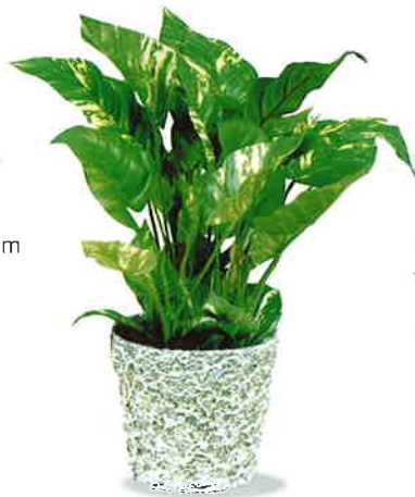
品番/PF37 品名/ポトスポット サイズ(約)/高さ30cm×幅15cm