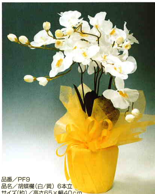
品番/PF9 品名/胡蝶欄(白/黄) 6本立 サイズ(約)/高さ65×幅40cm