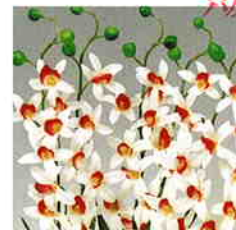
販売中止 品番/PF21 品名/シンビジウム(赤/白) サイズ(約)/高さ65×幅40cm