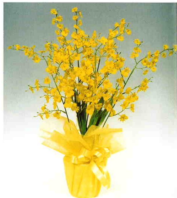
品番/PF23 品名/オンシジウム(黄) サイズ(約)/高さ65×幅40cm