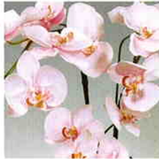
品番/PF4 品名/胡蝶欄(ラベンダー) 3本立 サイズ(約)/高さ70×幅40cm