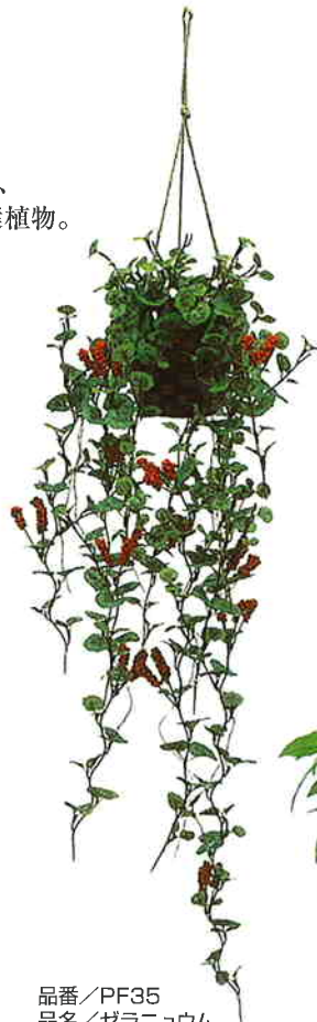
品番/PF35 品名/ゼラニウム サイズ(約)/高さ55cm

植物が空中に吊り下げられている様子はとても新鮮でインテリアの一要素として、窓ぎわや壁まわりに飾って楽しめます。