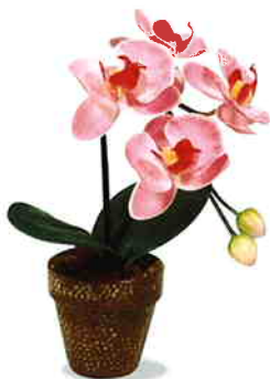
品番/PF13 品名/ミニ胡蝶蘭(赤) サイズ(約)/高さ22×幅10cm