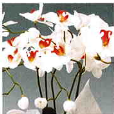
品番/PF7 品名/胡蝶欄(白/赤) 6本立 サイズ(約)/高さ65×幅40cm