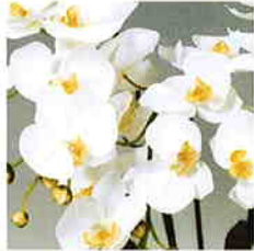
品番/PF3 品名/胡蝶欄(白/黄) 6本立 サイズ(約)/高さ70×幅40cm