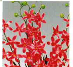
販売中止 品番/PF22 品名/シンビジウム(赤) サイズ(約)/高さ65×幅40cm