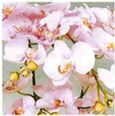
品番/PF2 品名/胡蝶欄(ラベンダー) 6本立 サイズ(約)/高さ70×幅40cm